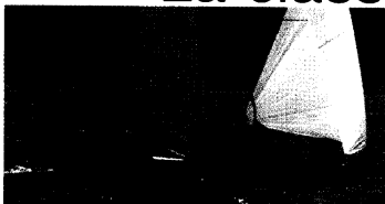
Le RC 27 RTN, un ancien M2.